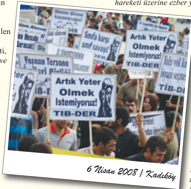
6 Nisan 2008 | Kadıköy