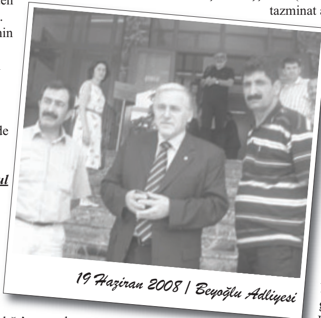
19 Haziran 2008 | Beyoğlu Adliyesi