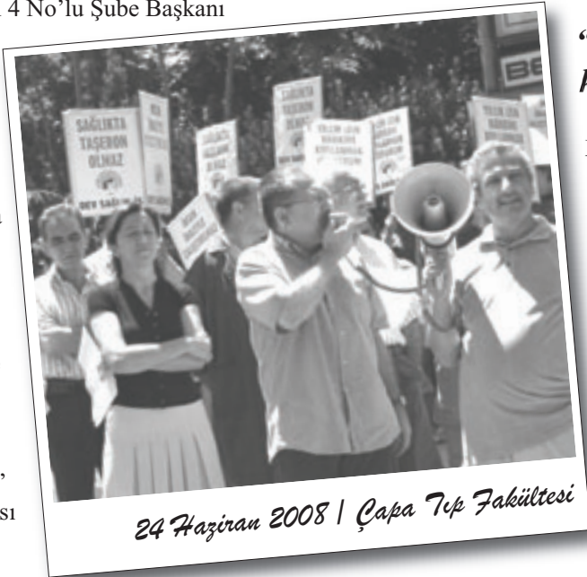
24 Haziran 2008 | Çapa Tıp Fakültesi

yürüdüler. "Sağlığın ticarileşmesine, Tam Gün kölelik düzenine hayır!" pankartıyla yürüyen TTB üyeleri referandum sonuçlarını basına ve kamuoyuna