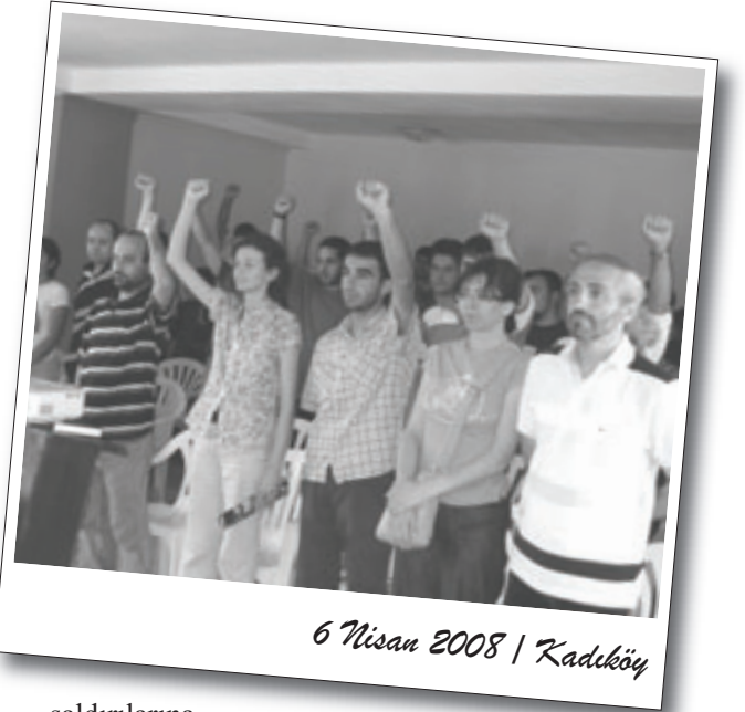
6 Nisan 2008 / Kadıköy

Sonrasında sosyal yıkım saldırılarının kapsamı ve mantığına ilişkin bir tartışma ile birlikte sosyal yıkım