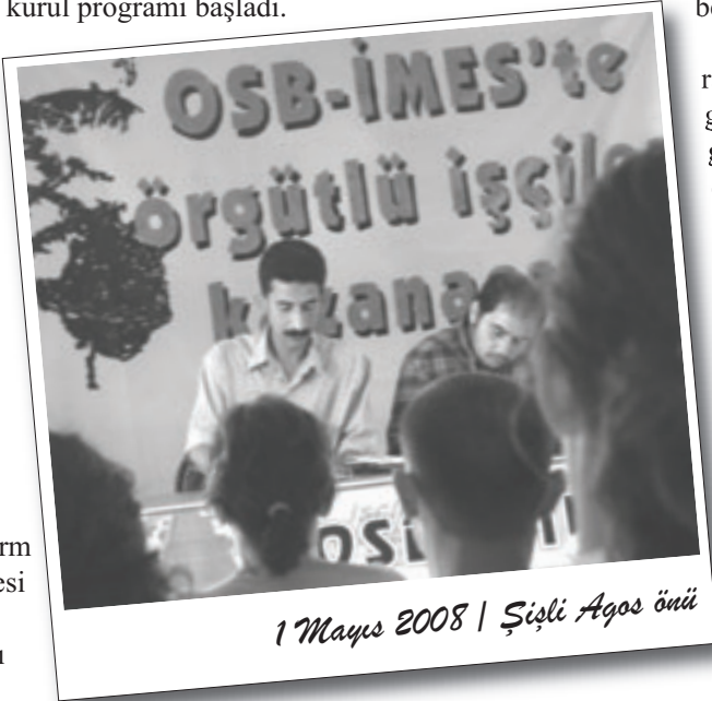
1 Mayıs 2008 / Şişli Aqos öni