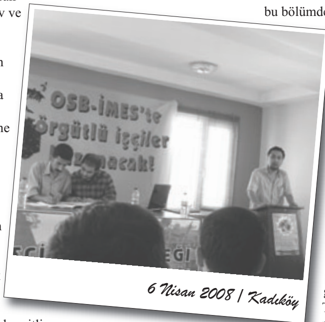
6 Nisan 2008 / Kadıköy